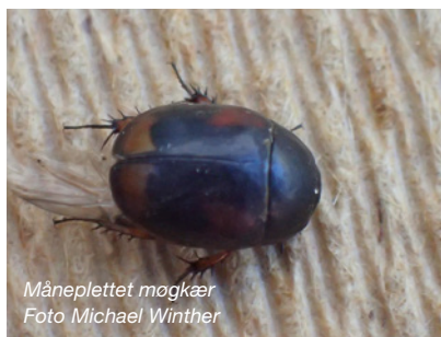
Måneplettet møgkær

dog i nogle tilfælde være lidt svært at se, hvornår den ene del slutter, og den anden begynder. Møgkærer svømmer bogstavelig talt rundt i lorten. De graver ikke, som torbisterne, men deres gode svømmeben og flade, runde krop gør det nemt for dem at svømme rundt.