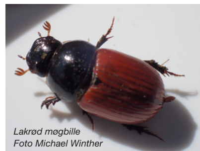
Lakrød møgbille

Lakrød møgbille er en art, som er meget synlig, da den har flotte røde dækvinger.