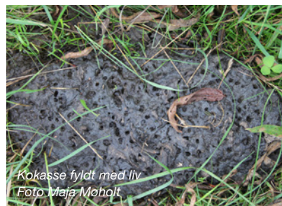
Kokasse fyldt med liv

Alle torbister i lort graver gange. Møgbillerne graver gange i selve lorten, hvor de laver et lille børneværelse. Møggraverne graver gange ned i jorden lige under lorten. Hervede laver de små børneværelser, hvori de putter en klump lort til larven. Ovenpå denne klump lort lægges et æg. Skarnbasser graver gange ned i jorden ved siden af lorten.