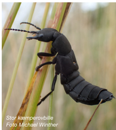
Stor kæmperovbille

Derudover findes der en del andre billearter, der også lever i lort, men ikke af det. Det er fx rovbiller, der er meget aflange biller, med korte dækvinger, som kun lige dækker brystet. Robiller er, som navnet peger på, rovdyr. De æder æg og larver i lorten, samt diverse smådyr.