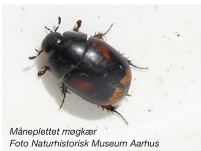
Måneplettet møgkær

Måneplettet møgkær er den største af møgkæerne. Den er nem at kende, da den har to gullige pletter bagerst på dækvingerne og to mørkerøde pletter forrest. De røde pletter er nogle gange svære at se, så det kan hjælpe at se den fra flere sider.