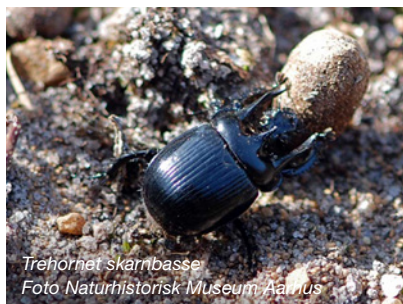
Trehornet skarnbasse

Trehornet skarnbasse er en af de meget få arter af gødningsbiller, vi har i landet, der triller en klump lort hen til deres gang. De lever i monogame forhold, dvs. en han og hun bliver sammen hele deres voksne liv. Skarnbassernes gange til børneværelserne kan være helt op til 1 meter dybe og de tager ofte 3-4 dage at grave! Med så dybe gange, vil der typisk være flere børneværelser.